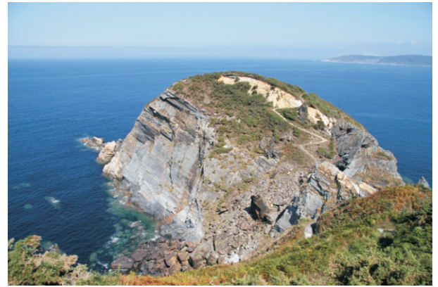
Punta Fuciño do Porco.