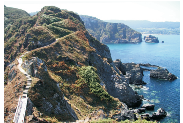
Vista do sendeiro desde a punta Fuciño do Porco.

Unha ruta para contemplar as paisaxes da ría de Viveiro e espectaculares vistas dos cantís da zona, así como gozar dun museo de xeoloxía ao natural.