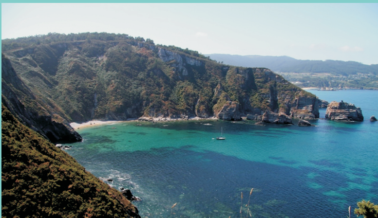
Enseada da Pereira desde a punta Fuciño do Porco.

Desde Viveiro, pola estrada que vai ao Vicedo cóllese o primeiro cruce á dereita que indica praia da Abrela á que se chega en 2 km. Pódese chegar ata o cruce anterior, ao rematar a subida da praia, ou deixar alí o coche e facer toda a ruta a pé, o que aumenta a distancia en medio quilómetro pero faina máis completa.